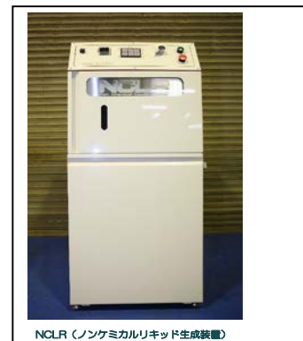
NCL (ノンミセルリキッド生成装置)

国内では年間 40 万トンもの塗料が産業廃棄物の汚泥として処分されていたものが、含有水分ゼロになり、廃プラスチックとして処分が可能になり、処理費用が格段に削減されるようになりました。